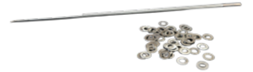
„Made in Rhede“: Nadeln sowie Distanz- und Passscheiben