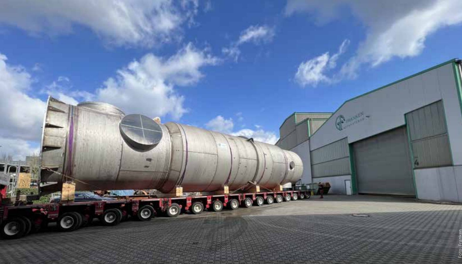
Bis zu 50 Meter hoch und 200 Tonnen schwer können die Apparate aus dem Hause Franken sein.