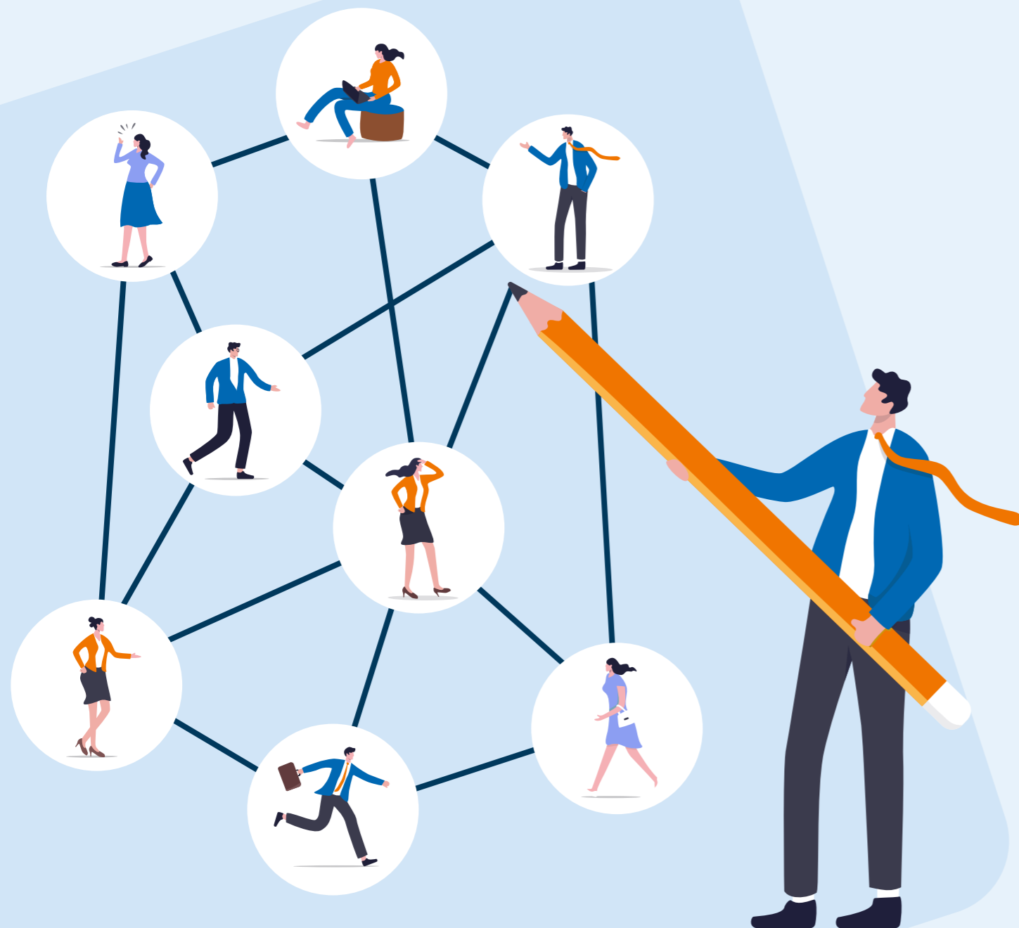
Unser Team organisiert Impulse & Networking für unsere Mitgliedsunternehmen.

Networking und frische Impulse sind für Unternehmer entscheidend, weil sie #NeuePerspektiven eröffnen, Chancen schneller sichtbar und nachhaltiges Wachstum möglich machen. Die Mitgliedschaft im Unternehmerverband bringt ein breites Netzwerk mit vielen Veranstaltungen, Formaten und Aktivitäten mit sich.