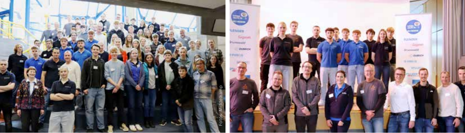
Den acht Schülerteams stehen die Firmen – Ausbilder und Agubis (Foto rechts) – beratend zur Seite. Während die Grunewald GmbH den Wettbewerb bereits seit 2009 mit ausgerichtet, sind zum dritten Mal zusätzlich die Firmen Flender, Gigaset, Pieron, Spaleck sowie Spaleck Oberflächentechnik dabei.