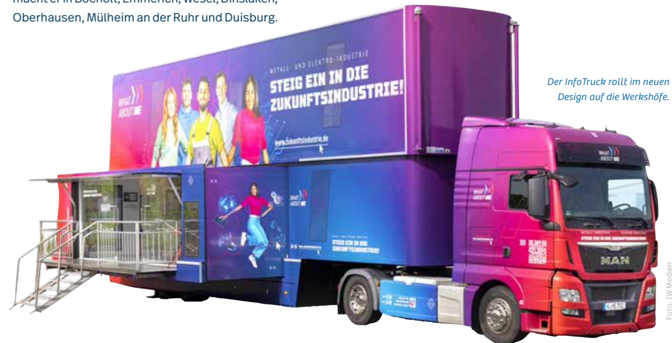
Der InfoTruck rollt im neuen Design auf die Werkshöfe.

sind mit im Truck und beantworten auf Augenhöhe sämtliche Fragen der Jugendlichen. Der InfoTruck verbindet damit modernste Technik mit praxisorientierter Berufsorientierung – und zeigt Jugendlichen, wie spannend die Metall- und Elektroindustrie heute arbeitet.