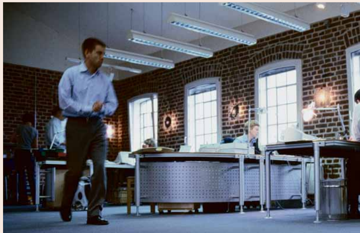
46 Mitarbeiterinnen und Mitarbeiter beherbergt das alte Mülheimer Fabrikgebäude

Dafür versteht sich Q:marketing jedoch als Familienunternehmen. Dass die drei Vorstände sämtlich Mittvierziger sowie Väter sind und von daher Verständnis für die Doppelbelastung aus Familie und Beruf haben, „führt zwar nicht dazu, dass wir ein Arbeitszeitmodell haben oder einen Wickelraum, aber dafür Teilzeitjobs anbieten und immer Wege finden, wenn es zwischen Job und Kindererziehung Konflikte gibt.“ Überhaupt, so formulieren es die beiden Windfeders und Dworak unisono, ist „Vorbild sein für uns das wichtigste Führungsinstrument.“ Das geht so weit, dass die einstige Unternehmensgründung